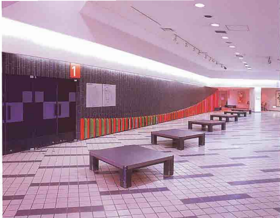
●大ホールホワイエ